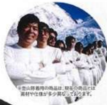
※登山隊着用の防寒用品は、職種の異なることで 素材や仕様が多少異なっております。